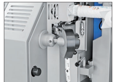
Die Etiketten werden mit dem Printsysteem präzise bedruckt und über den Etikettenspender positionsgenau mit eingeklippt.