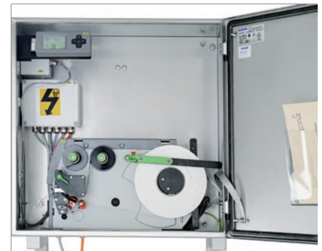
Etiketten und Printsysteem sind in einem hermetisch abgedichteten Edelstahl-Gehäuse eingebaut

Das Etikettiersystem TagPrint TD60 wird hinter der Clipmaschine positioniert und mit den Feststellrollen fixiert. Ein Kommunikationskabel verbindet das TD60 mit dem Clipper. Die Etiketten werden von der Rolle in das Printsysteem eingeführt und im Thermotransfer-Verfahren bedruckt. Die einseitig bedruckten Etiketten laufen über den Etikettenspender in den Clipbereich des Doppelclipautomaten. Anschliessend wird das Etikett in den Clip gelegt und abgeschnitten. Die Steuerung erfolgt über den Swipper oder mit einer eigenen speicherprogrammierbaren Steuerung. Die Taktgeschwindigkeit des Clippers wird durch das Einlegen der Etiketten nicht reduziert.