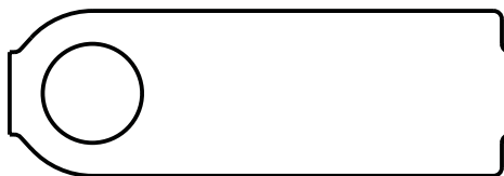
Etikett in Originalgröße