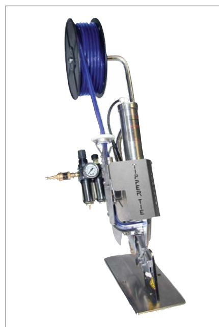
Клипсатор SP100 с синими клипсами в качестве опции

Как вертикальные, так и горизонтальные модели могут работать с пластиковыми катушечными клипсами белого или трех иных цветов. Катушечные клипсы обеспечивают более продолжительную и эффективную работу. P-120SP – это стандартная белая клипса. Для цветных клипс минимальное количество для заказа составляет миллион штук, они доступны в синем (P-130SP), фиолетовом (P-140SP) и розовом (P-150SP) цвете.