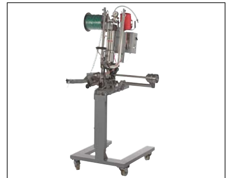
DCM mit Unterwagen