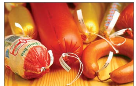
Produkte mit Etiketten und Schlaufen