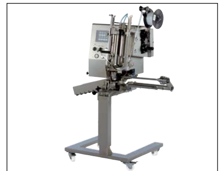
KDCM mit elektronischer Steuerung