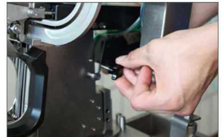
Servicefreundlich: Messerwechsel ohne Werkzeug