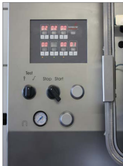
Die Bedienung des KDCM erfolgt über ein modernes Digitaldisplay.

Digitales Display mit 20 speicher- und abrufbaren Programmen. Dieses moderne und leicht bedienbare System lässt in Bezug auf Komfort, Hygiene und Effizienz keine Wünsche offen. Die Systemoberfläche beinhaltet die Funktionen Messer-, Schlaufen- und Etikettenzähler.