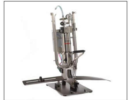
DCM mit Grundplatte