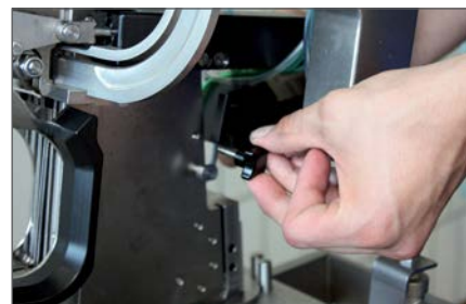
Удобство в обслуживании: смена ножей без инструментов