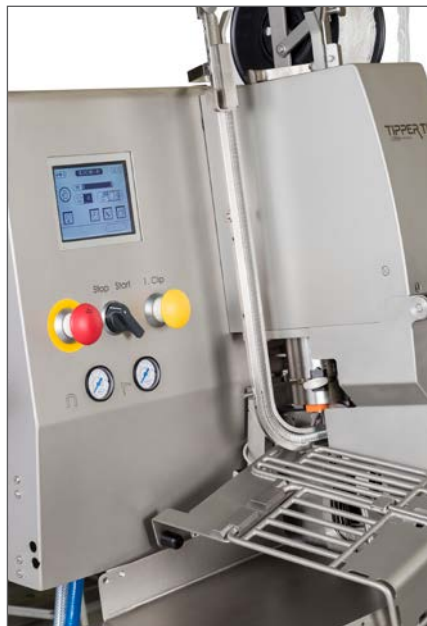
Легкая очистка благодаря гладким поверхностям.

Сенсорный экран, память на 50 исполняемых программ Управление машиной KDCMA производится с сенсорного экрана. Эта современная система управления с интернациональными символами (пиктограммами) удовлетворяет всем мыслимым желаниям в отношении комфорта, гигиены и эффективности. Интерфейс включает в себя функции счетчика остановок, порций в минуту, меню системных настроек, меню выключателей машины, протокол ошибок, меню настроек продукта позиции ошибки, теста петель, теста этикеток, индикации пуска дозатора.