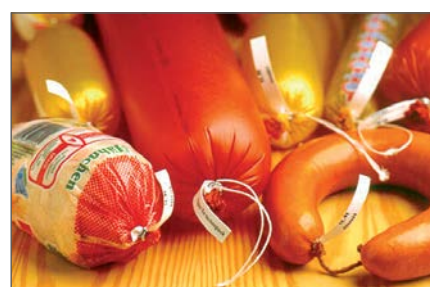
Колбасы с этикетками