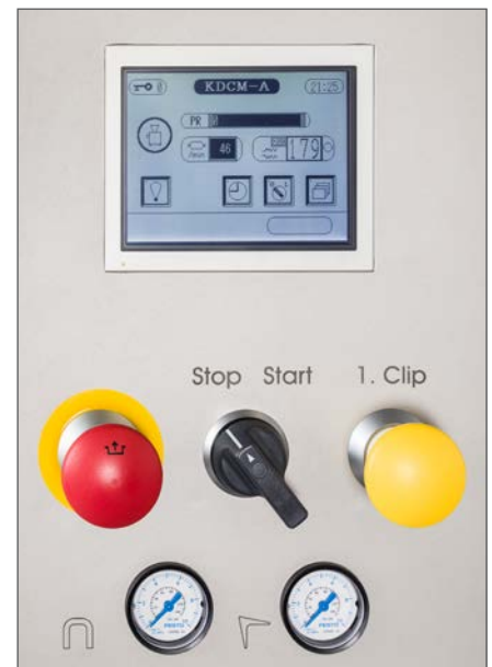
Управление машиной KDCMA производится с сенсорного экрана.