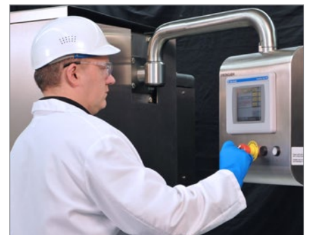
Frei einstellbare Einstoßergeschwindigkeit und -druck auf der Basis der Produktanforderungen.

Die wichtigsten Unterscheidungsmerkmale zwischen TN4001 und TN4200 sind Geschwindigkeit, Länge der Muskelfleischprodukte, die jede Maschine verarbeiten kann, sowie das Ausmaß der erzielten Kompression.