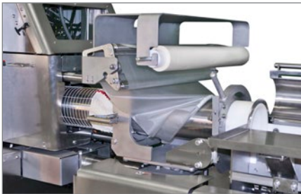
Das optionale Collagenfilm-Modul verbessert die Optik von Schinkenprodukten durch attraktiven Glanz und ein gleichmäßiges Netzmuster.