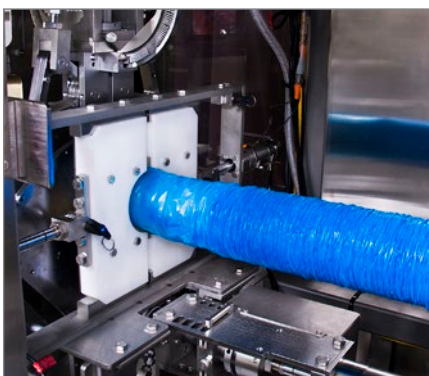
Vollständiger Zugriff zum Austausch von Rohren, Darmbremsen und zur Einstellung des Verdrängerhubs.

Der TN4001 ist für die gleichzeitige Verpackung eines oder mehrerer Muskelabschnitte bei Geschwindigkeiten von 11 bis 13 Teilen pro Minute konzipiert. Seine servogestützte Verschlusseinrichtung wendet leichten Druck an, um das Fleisch mit oder ohne Collagenfilm in Netze oder nur in Därme zu pressen. Ein einzelner Bediener richtet das Produkt in der Einlegekammer aus, schließt die Tür und startet den Verpackungsvorgang. Wie alle leistungsfähigen Systeme ist die Verarbeitung verschiedener Produktgrößen mit dem TN4001 bequem und einfach. Sein Schnellwechsel-Verschlusssystem ist in Größen von 76,2 mm (3 Inch) bis 203 mm (8 Inch) erhältlich und kann in nur 15 Minuten ausgetauscht werden. Für noch mehr Flexibilität steht ein optionaler Schlaufenzubringer zur Anbringung einer sicheren Schnurschleufe bei hängenden Produkten zur Verfügung.