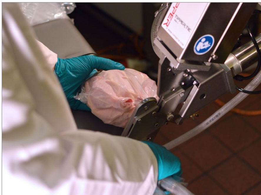
Птица после вакуумной упаковки в установке TTBagS готова для термоусадочной камеры.

Оптимальное решение для вертикальной упаковки предлагает модель TTBagV . Пакет автоматически открывается продувкой, оператор вставляет продукт в пакет, вытаскивает пакет из шлюза и вставляет в горизонтальный клипсатор